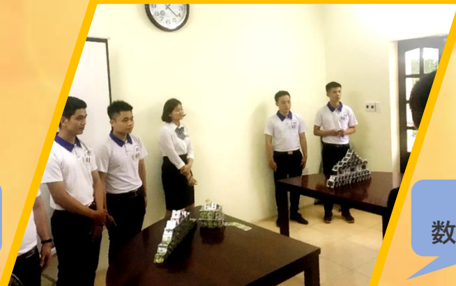
高度な 数学テスト