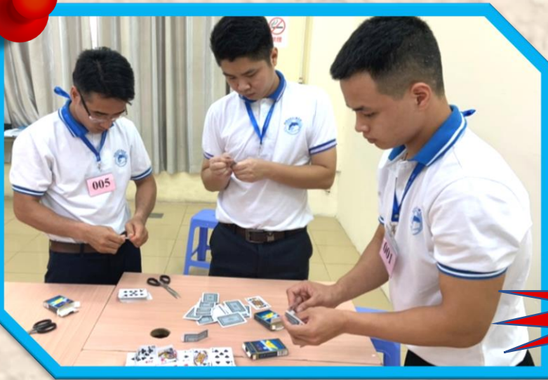
ワークショップ中