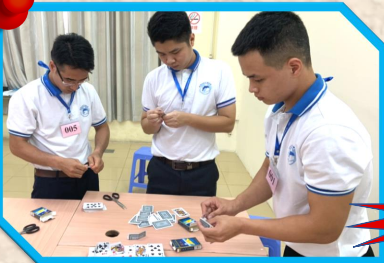
ワークショップ中