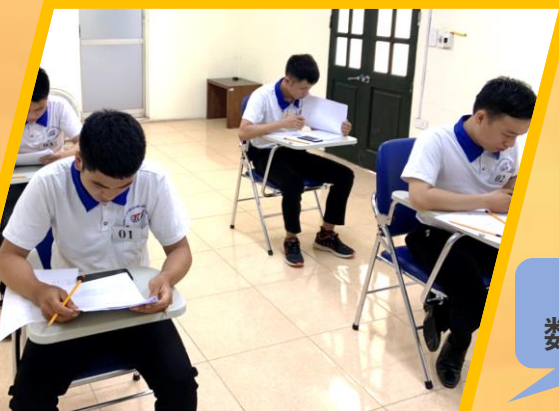
高度な 数式テスト

今回の面接会で企業様はとてつご満足頂けたようで、帰国後に、早速追加で別職種でのベトナム人人材を採用したいという要望を頂きました。