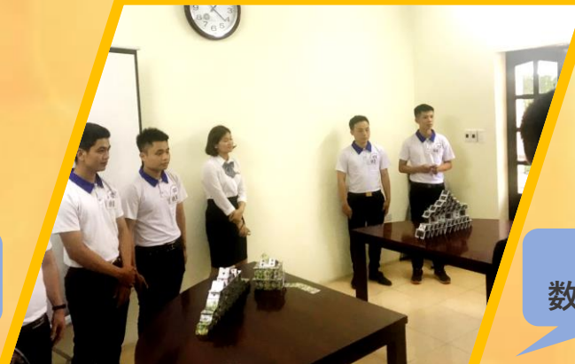
高度な 数学テスト