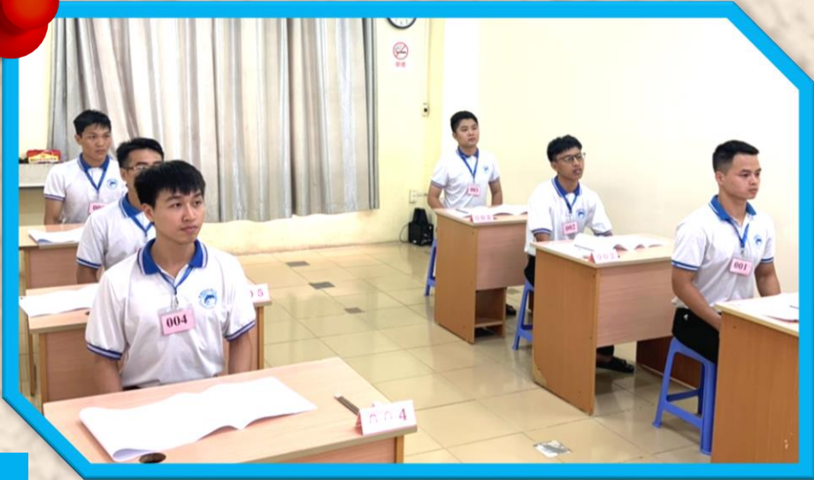
数式テストに臨む人材達

今回の委託面接の総採用人数枠及び総応募者数が多いため、ベトナム現地での面接会場は2会場に分けて開催致しました。