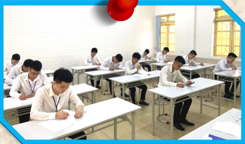
技術者専用の数式テスト